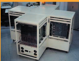
並列 コンピュータ