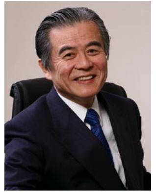
東京大学総長 小宮山 宏