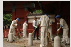
障害者雇用の推進（環境整備風景）