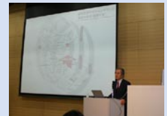
アクション・プラン全学説明会