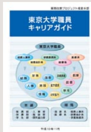
東京大学職員キャリアガイド