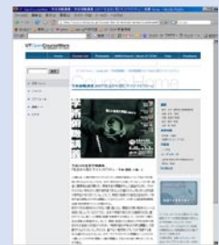
UTOCW WEB サイト