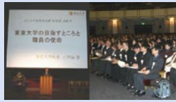
業務改善総長賞表彰式