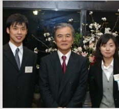
総長大賞受賞者との懇談会