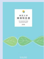
東京大学環境報告書