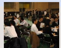
知の創造的摩擦プロジェクト